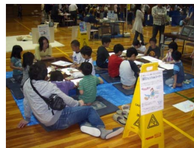
8つ切りの画用紙に絵を描いていく子供たち