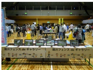
当日は、のぼりを立てて会場にブースを設営